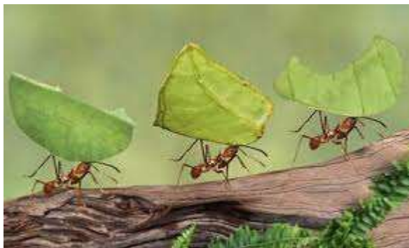
FIG.2- LE FORMICHE TAGLIAFOGLIE

https://youtu.be/EkwbC2s_dFM ATTIVITA' MOTORIO MUSICALE